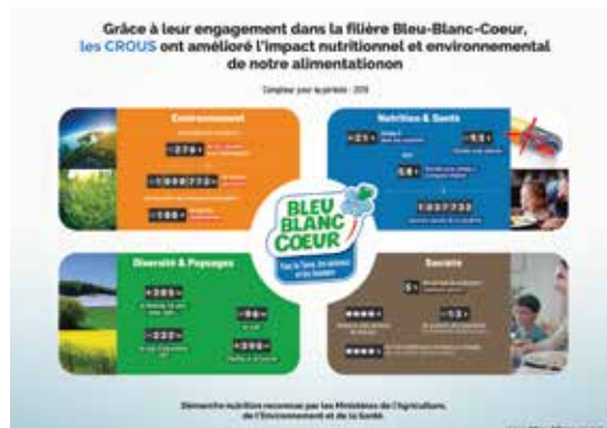
Compteur éco-nutrition 2019 du Crous de Nantes Pays de la Loire

L'association Bleu-Blanc-Cœur a remis au Crous de Nantes Pays de La Loire le trophée de la Nutrition durable en février 2020, reconnaissant ainsi l'effort fait par le Crous (en particulier la Direction Restauration et le Service communication) quant au développement et à la promotion de produits aux labels durables et responsables comme Bleu-Blanc-Cœur.